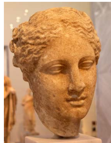
1 Göttin Hygieia

Am vorletzten Tag unserer Studienfahrt stand der Besuch des archäologischen Nationalmuseums im Mittelpunkt. Nach dem morgigen Frühstück begaben wir uns dem nicht sehr langen Spaziergang zum Museum. Das große, sehr schöne Gebäude versprach schon durch sein äußeres Wirken vieles. Diese externen Versprechen wurden im Museum selber erfüllt: Tausende antike Kunststücke, Statuen und Gegenstände konnten wir in den Stunden unseres Besuches betrachten und darüber staunen, was alles in der antiken und auch prähistorischen Zeit geschafft und gemacht wurde. Es gibt in diesem Museum nämlich nicht nur Werke aus der uns eher bekannten antiken griechischen Zeit, sondern auch Töpferei u. Ä., das vor mehr als fünf Tausend Jahren hergestellt wurde. Auf diese Weise konnten wir einen guten Eindruck über die verschiedensten Zeitalter gewinnen, die in dieser prächtigen Sammlung von Stücken hervorragend